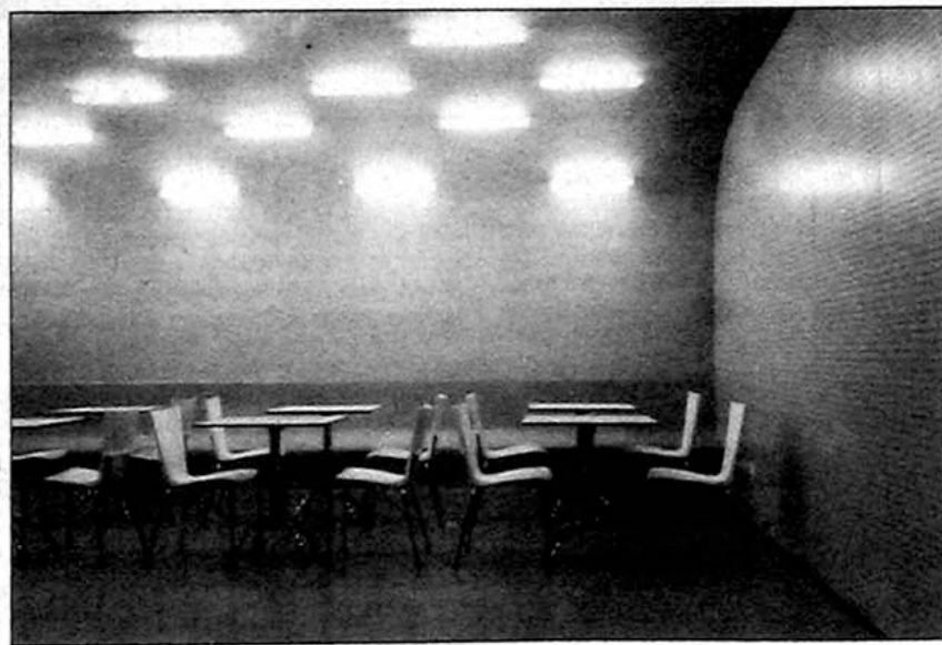
Večnamenski prostor za malice in sestanke, zasnovan kot intimna lupina v topli oranžni barvi.