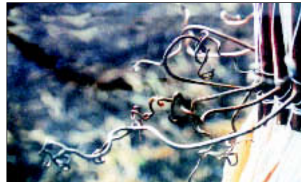
Stanislava Vauda Benčević - oblačila