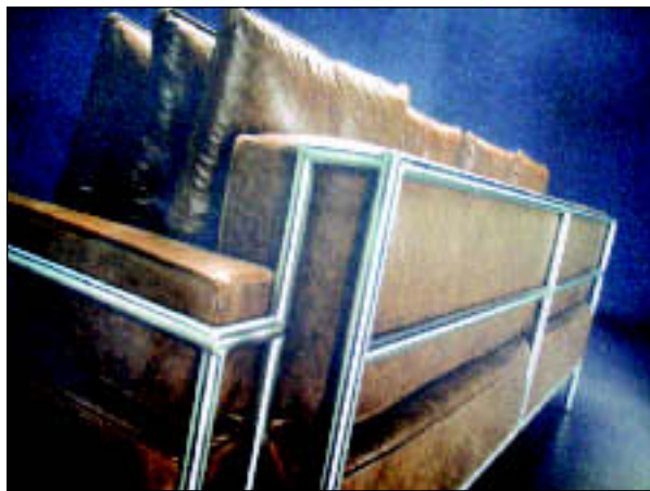
Grazia Ferlazzo - počivalnik