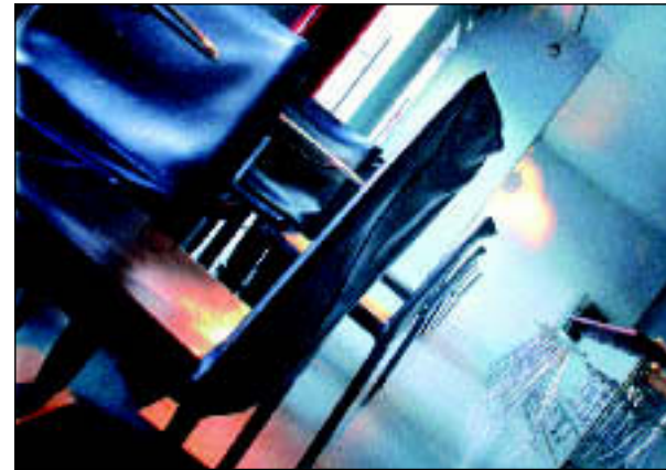
Stojan Skalicky - Caffè Piranha