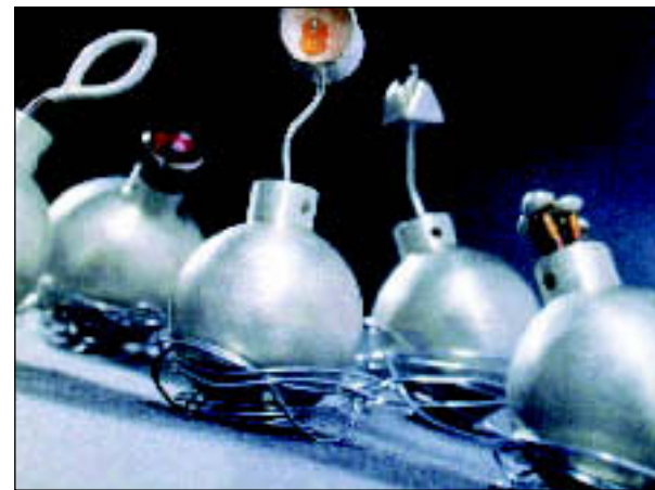
Nataša Grandovec - nakit